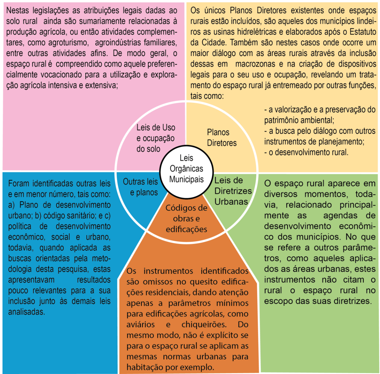
Figura 02: Convergências acerca do rural entre os principais instrumentos de planejamento territorial analisados.