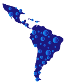
Figura 1 – Gestão humanizada e princípios cooperativistas nas práticas da agência Sicredi