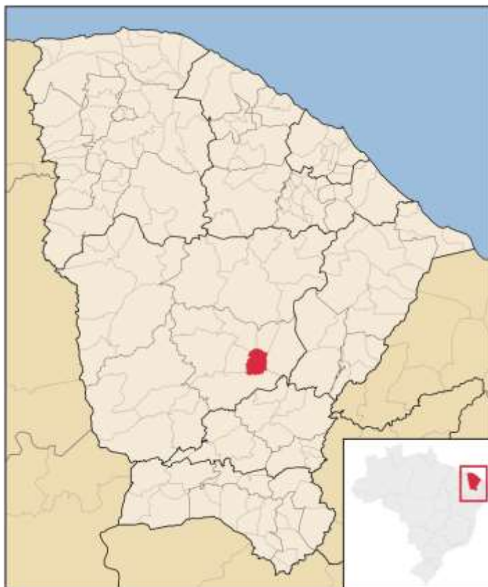
Figura 2: Mapa do Município de Irapuan Pinheiro/CE

O Município de Irapuan Pinheiro está localizado no Estado do Ceará, especificamente no sertão cearense, e contava com população de 9.095 pessoas no Censo de 2010, atualmente está estimada em 9.585 (2018). Com território de 470,425 km 2 , a densidade demográfica em 2010 era de 19,33 hab/ km 2 . (IBGE, 2010).