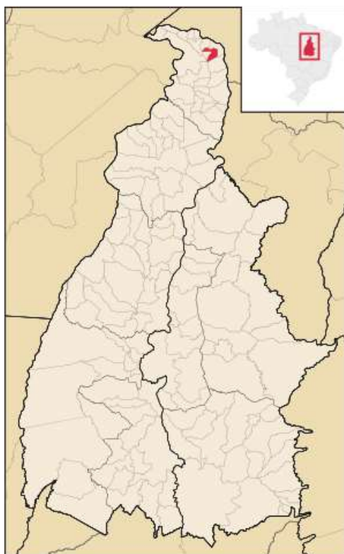
Figura 1: Mapa do Município de Sítio Novo do Tocantins/TO

O Município de Sítio Novo do Tocantins está localizado na Região do Bico do Papagaio, norte do Tocantins, que oferece poucas condições para desenvolvimento da população (MIRANDA; SANTOS, 2014). Segundo Santos e Miranda, o Bico do Papagaio, durante as décadas de 1970 e 1980, foi marcado por intensos conflitos de terras, cujos resquícios ainda podem ser notados. A microrregião é considerada uma das mais pobres do Estado do Tocantins, pois não há indústrias ou agroindústrias que diversificar a base produtiva da região (MIRANDA; SANTOS, 2014).