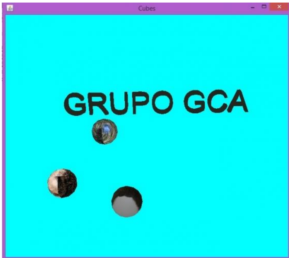
(Figura 2, Universo Tridimensional com figuras geométricas criado a partir do uso da linguagem de programação JAVA3D)

Modalidade do trabalho: Relatório técnico-científico Evento: V Seminário de Inovação e Tecnologia