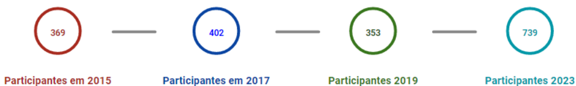
Figura 1 - Comparativo respondentes Pesquisa de Imagem UNIJUÍ 2015-2023

Os dados desta pesquisa foram organizados em âmbito institucional, englobando os quatro campi. Na análise chama a atenção o maior índice de adesão desde que iniciou a pesquisa conforme a Figura 1,