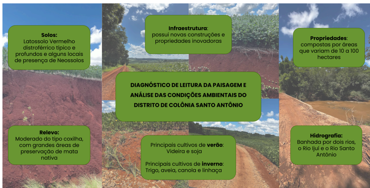
Figura 2: Diagnóstico de leitura da paisagem e análise das condições ambientais do distrito de Colônia Santo Antônio, município de Ijuí/RS.

Os solos da região são predominantemente Latossolo Vermelho distroférico típico, profundos, possuindo alguns locais de presença de Neossolos este é possível perceber visualmente o processo de intemperismo da rocha. A região possui uma hidrografia diversificada, sendo banhada por dois rios, o Rio Ijuí este que faz divisa entre os municípios de Ijuí e Coronel Barros e o Rio Santo Antônio que faz divisa entre os municípios de Ijuí e Catuípe. Ademais, foi desenvolvido um mapa mental (Figura 2) para demonstrar a vasta diversidade geográfica da localidade.