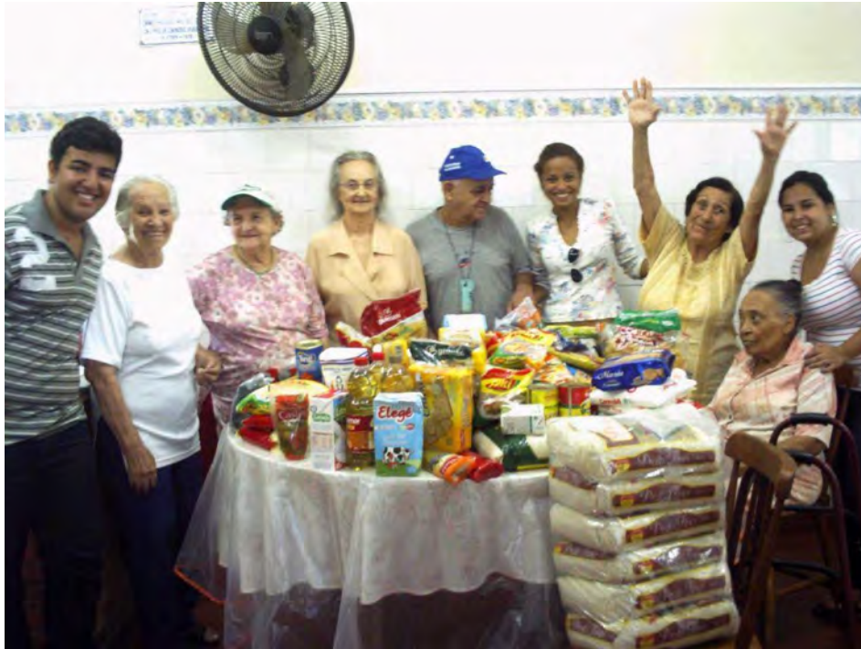
Doação de alimentos para o Asilo da cidade

Modalidade do trabalho: Relato de experiência Evento: XIII Jornada de Extensão