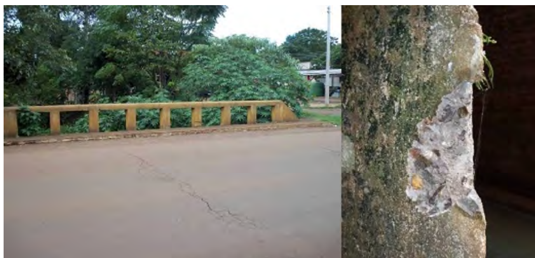
Figura 3: Ponte sobre Rio Itaquarinchim e seção totalmente carbonatada.

A ponte sobre o Rio Itaquarinchim está localizada na Rua Marechal Floriano Peixoto, entre os Bairros São Carlos e Meller Sul. A parte superior da ponte encontra-se com fissuras. O acesso não é difícil e a estrutura é bastante antiga. Em consequência a isso foi a ponte que apresentou o maior foco de carbonatação no ensaio, representada pela ausência de coloração. A quebra foi bastante fácil e profunda devido a fragilidade da construção.