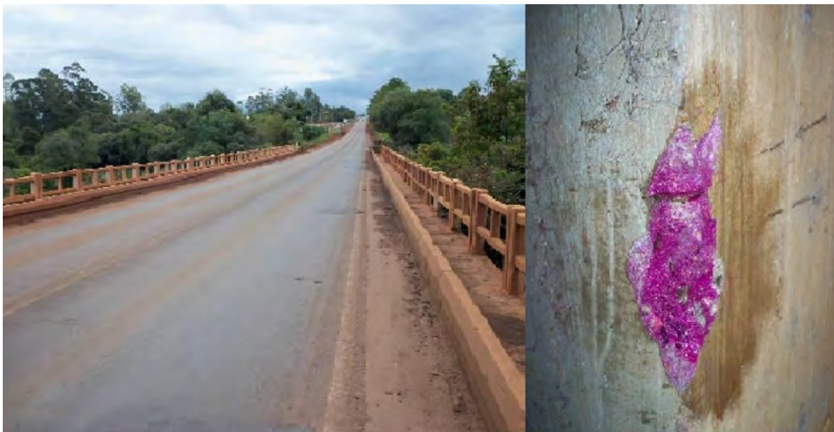
Figura 4: Ponte na ERS 344 e resultado do ensaio.

seção foi extremamente difícil devido a alta resistência do concreto. A ponte foi a que apresentou o melhor resultado no ensaio realizado, praticamente sem carbonatação.