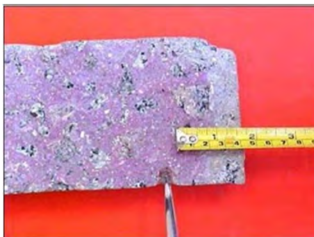
Figura 2: Teste de carbonatação com fenolftaleína.

Para a realização do teste com fenolftaleína será necessário efetuar a quebra transversal da seção do concreto em relação a direção da aplicação da solução, a fim de saber se o concreto foi carbonatado. Logo após a aspersão, sobre o concreto, este deverá apresentar coloração vermelho-rósea para pH acima de 8,3 (concreto não carbonatado). Ao apresentar-se de forma incolor, indica um concreto com pH abaixo disso, caracterizando com uma pequena margem de segurança, um concreto com carbonatação. A carbonatação não indica que a armadura esteja em processo de corrosão, porém, apresenta-se suscetível à corrosão desde que a zona analisada apresente desequilíbrio eletrolítico. O ensaio é demonstrado na figura 2.