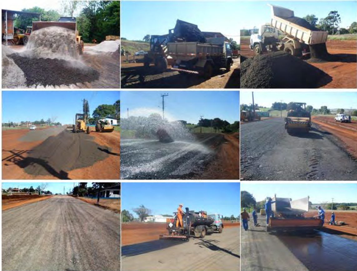
Figura 3: Execução da camada de base e do TSD

Evento: XX Seminário de Iniciação Científica