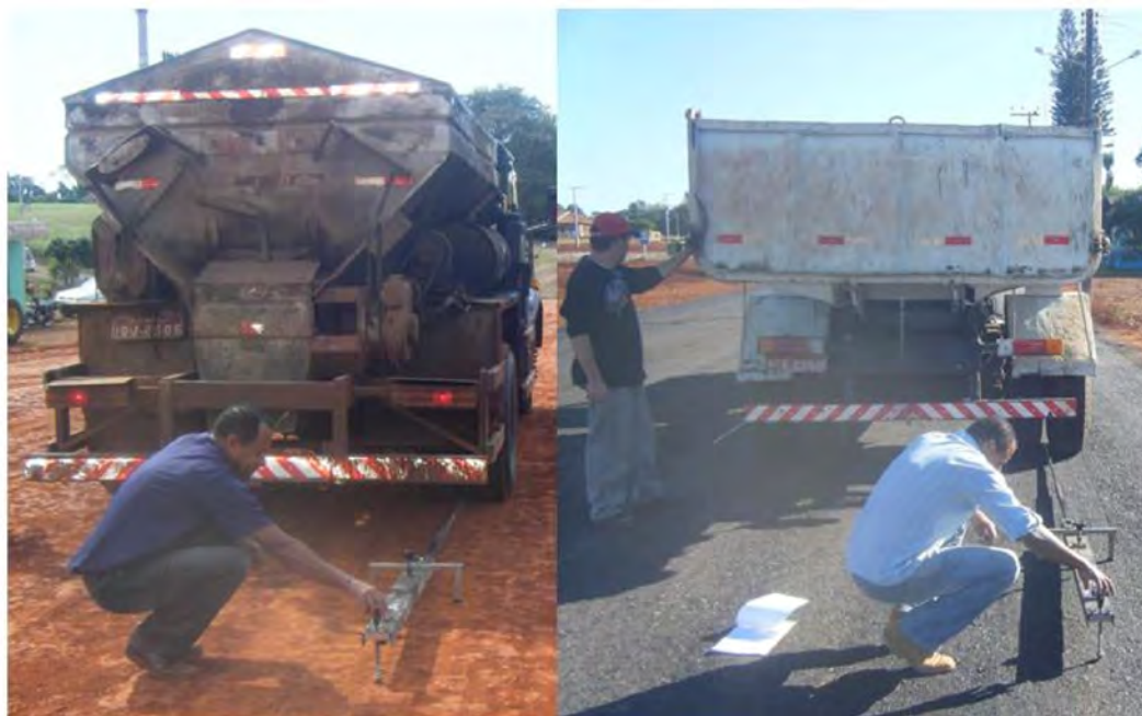
Figura 1: Levantamento das deflexões com VB no subleito e na base

Evento: XX Seminário de Iniciação Científica