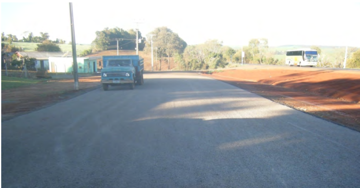
Figura 5: Aspetto final do trecho experimental (02/07/2012)

Evento: XX Seminário de Iniciação Científica