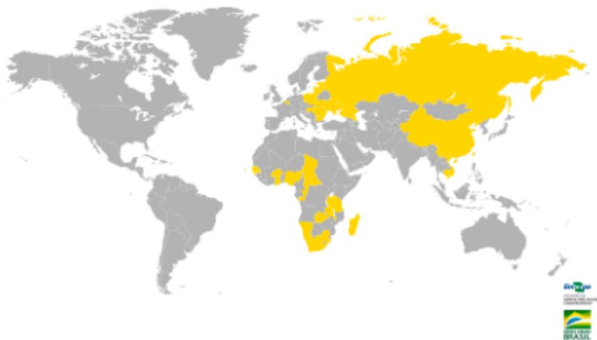
Figura 2. Situação atual mundial da Peste suína Africana (EMBRAPA SUÍNOS E AVES, 2020)

Um mapa mostra os países com suspeita, presença confirmada e introdução do vírus da PSA entre o segundo semestre de 2018 e o primeiro semestre de 2019. Fonte: OIE, World Animal Health Information System Mapa: Mapbox.com