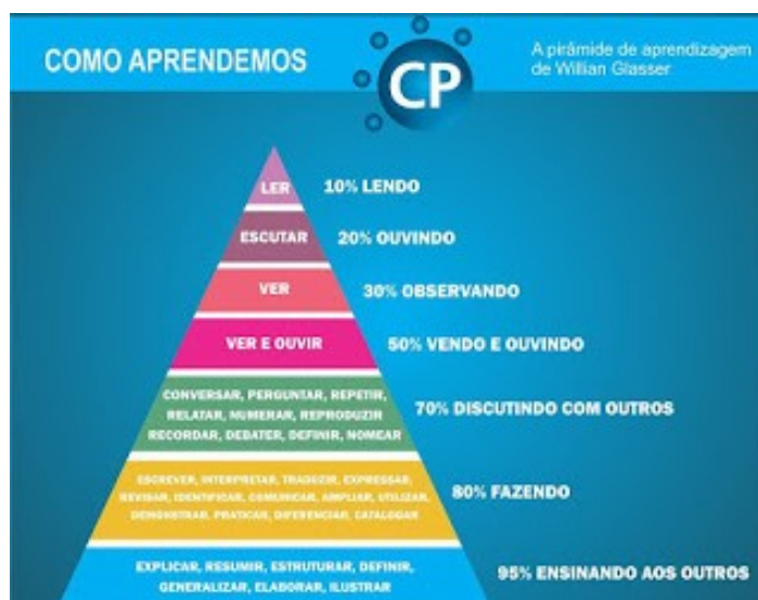
Figura 1: A pirâmide de aprendizagem de William Glasser. (Fonte: Buono, 2016).

Como o projeto abrange escolas e a comunidade de maneira geral, o propósito principal é a aquisição de conhecimento, que é explicada pela pirâmide de aprendizagem de William Glasser, conforme a Figura 1.