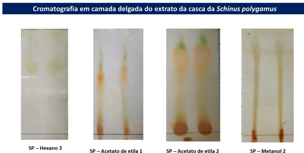
Figura 1 - Resultados da CCD para os diferentes extratos da casca da Schinus polygamus .

O surgimento de coloração laranja-amarelado ou amarelo-esverdeado é sugestivo da presença de substâncias como quercetina, mircetina e campferol. Já somente a coloração laranja é sugestivo da presença de leutonina e de azul de ácidos carboxílicos fenólicos e cumarinas (WAGNER; BLADT, 1996). Estudos vem demonstrando que a quercetina possui um excelente poder antioxidante in vitro, sendo o flavonoide de maior poder sequestrador de espécies reativas de oxigênio (ERO). Esta substância já teve sua presença confirmada em extrato metanólico da S. polygamus (ERAZO, 2006; HAUBER, 2008). Ao comprarmos a presença de compostos bioativos presentes em extratos da espécie Schinus lenticifolius , em estudo anterior realizado por nosso grupo de pesquisa (CORRÊA, 2019), a mesma apresentou ausência de compostos fenólicos no extrato hexânico, e a presença dessas substâncias nos extratos de acetato de etila e metanol, como o encontrado aqui para S. polygamus .