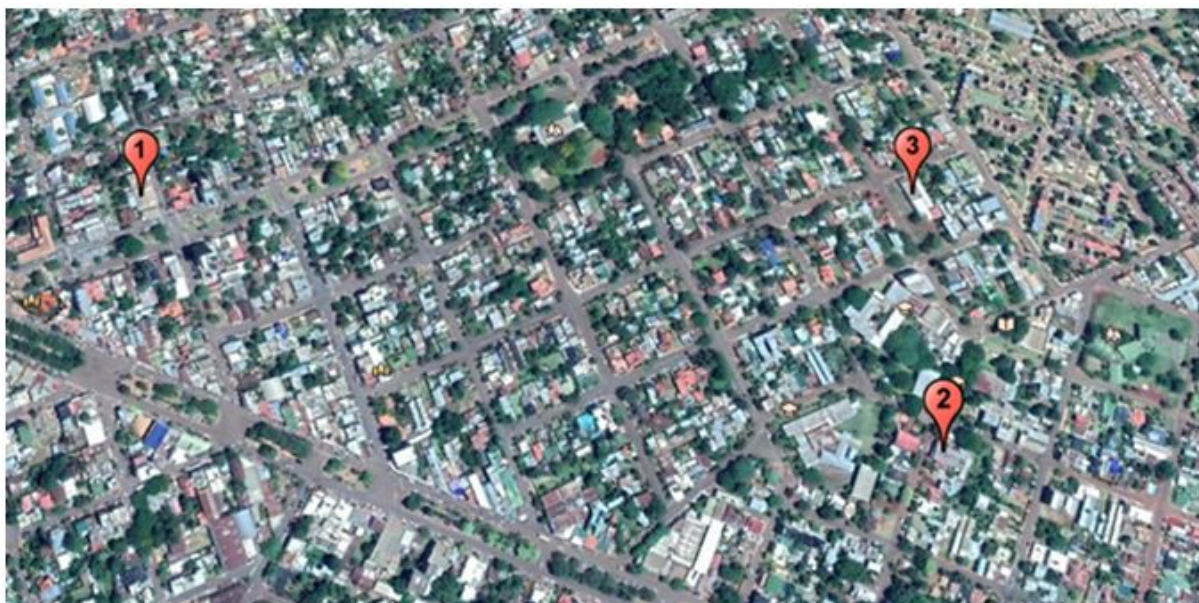
Figura 1: Establecimientos deportivos seleccionados.

La ubicación de los establecimientos seleccionados se observan a continuación (figura 1), punto 1 es una cancha de futbol 5, el punto 2 es un Gimnasio y el punto 3 es una cancha de paddle.