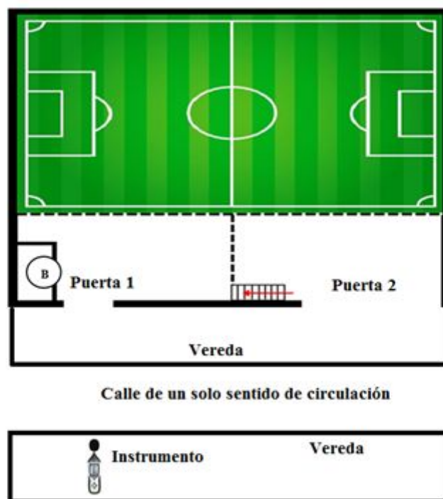
Figura 2: Ubicación del Instrumento cancha de futbol 5.

Evento: XXIV Jornada de Pesquisa - Participante ESTRANGEIRO