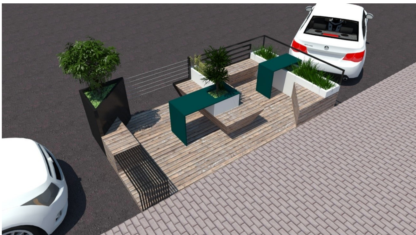
Imagem 3 - Vista isométrica do Parklet