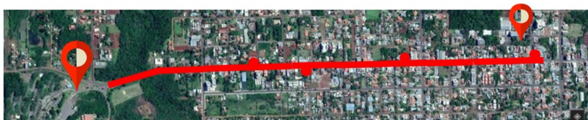
Imagem 1 - Extensão aonde serão implantados os Parklets