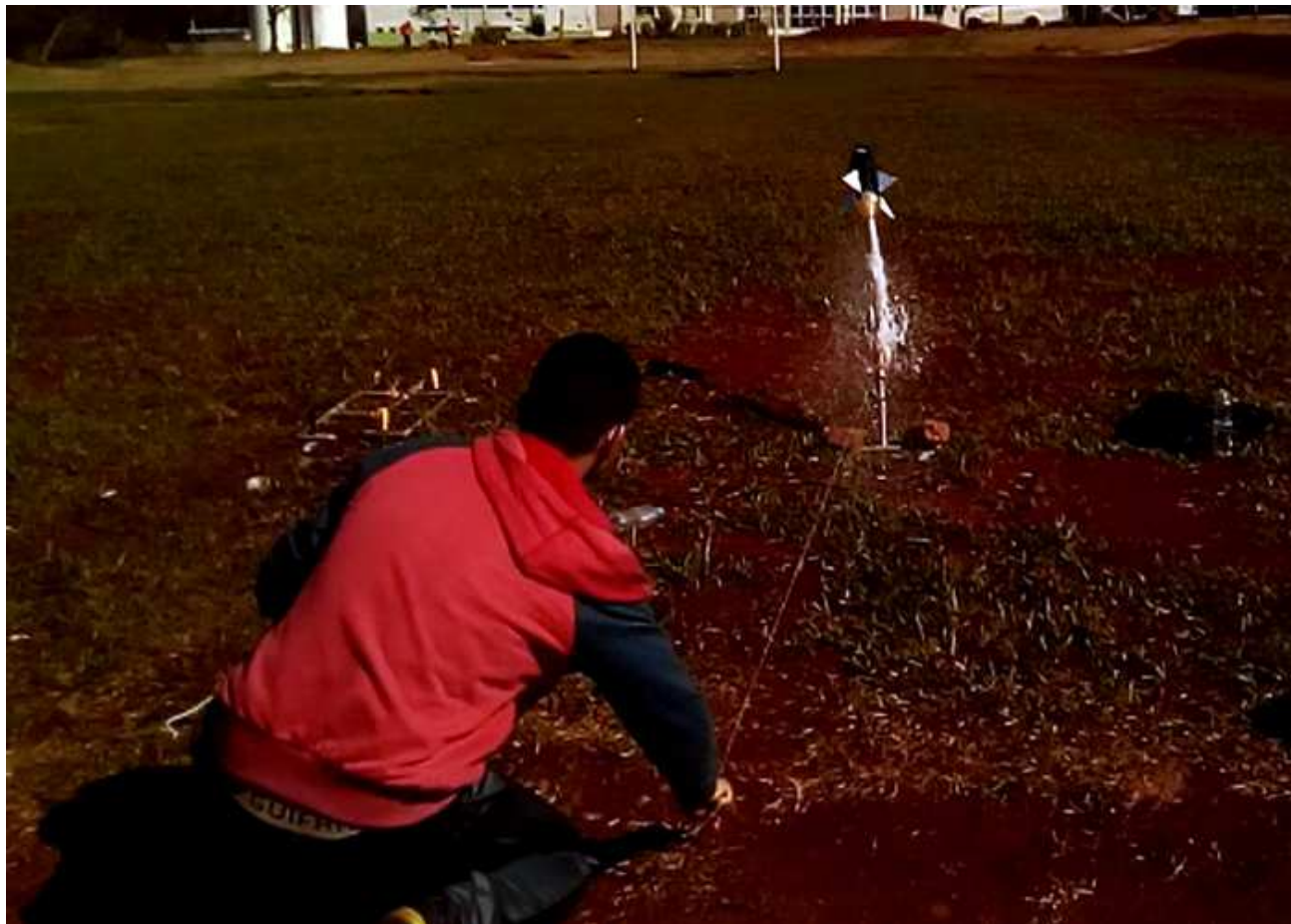
Figura 1: Lançamento do foguete.

Para que o lançamento ocorresse, as únicas substâncias que foram utilizadas/permitidas para a pressurização do foguete eram: água, vinagre com concentração de ácido acético em torno de 4% e bicarbonato de sódio em quaisquer proporções. Para cada lançamento a quantidade de vinagre permitida foi de no máximo 1500 ml e a quantidade de bicarbonato de 300g.