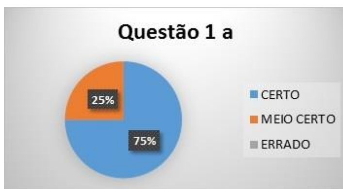
Figura A: Gráfico 1: Relação de erros e acertos da Questão 1 a, do questionário aplicado a alunos da 1ª série do EM.

Isso pode ser constatado ao analisar as questões do instrumento de investigação que realizamos. Observamos que questões não relacionadas com a periodicidade dos elementos químicos ou que não requerem justificativas, são respondidas com facilidade, resultando em um grande número de acertos entre os alunos que responderam o questionário. Isso significa que os estudantes sabem utilizar a TP como fonte de consulta de dados e, assim, promovem respostas de “decoreba”. A primeira questão do questionário aplicado consistia em identificar a família e o período a que pertence o elemento químico Cálcio. Poucos alunos confundiram-se ao visualizar a TP, e a maior parte acertou a questão, como está representado pela Figura A.