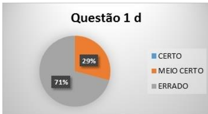
Figura C: Gráfico 2: Relação de erros e acertos da Questão 1 d, do questionário aplicado a alunos da 1ª série do EM.