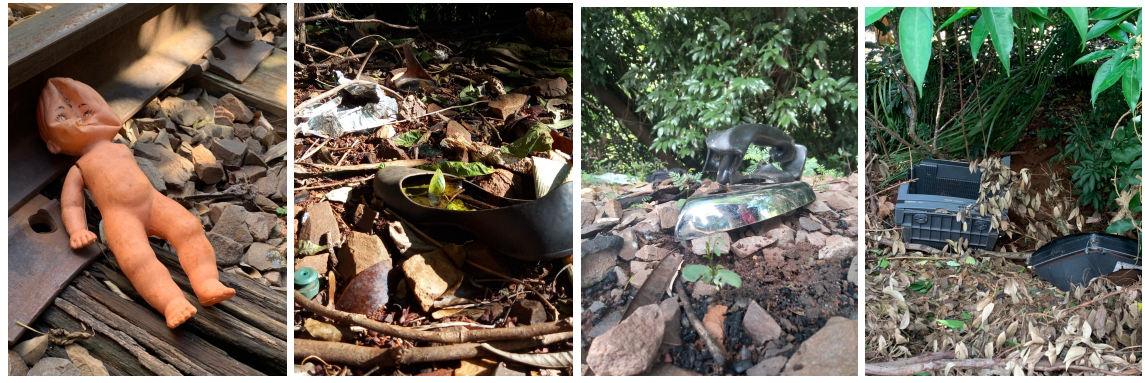
Figura 2 - Lixos descartados incorretamente próximo aos trilhos de trem em Ijuí-RS.

Em visita aos trilhos próximos a Escola Técnica Estadual 25 de Julho, como nota-se na Figura 2 abaixo, é possível observar a quantia de lixos descartados incorretamente: