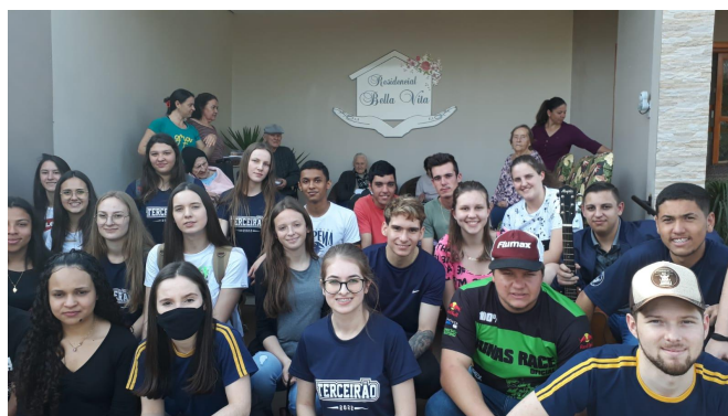
Fonte: Visita alunos CE Comendador Soares de Barros a Casa de Idosos Bella Vita, em 2022.

Visita ao lar dos idosos em nosso município denominado Bella Vita, com objetivo de compartilhar tempo, atenção, afeto, músicas e devocional além de alguns alimentos produzidos pelos próprios alunos na cozinha da escola.