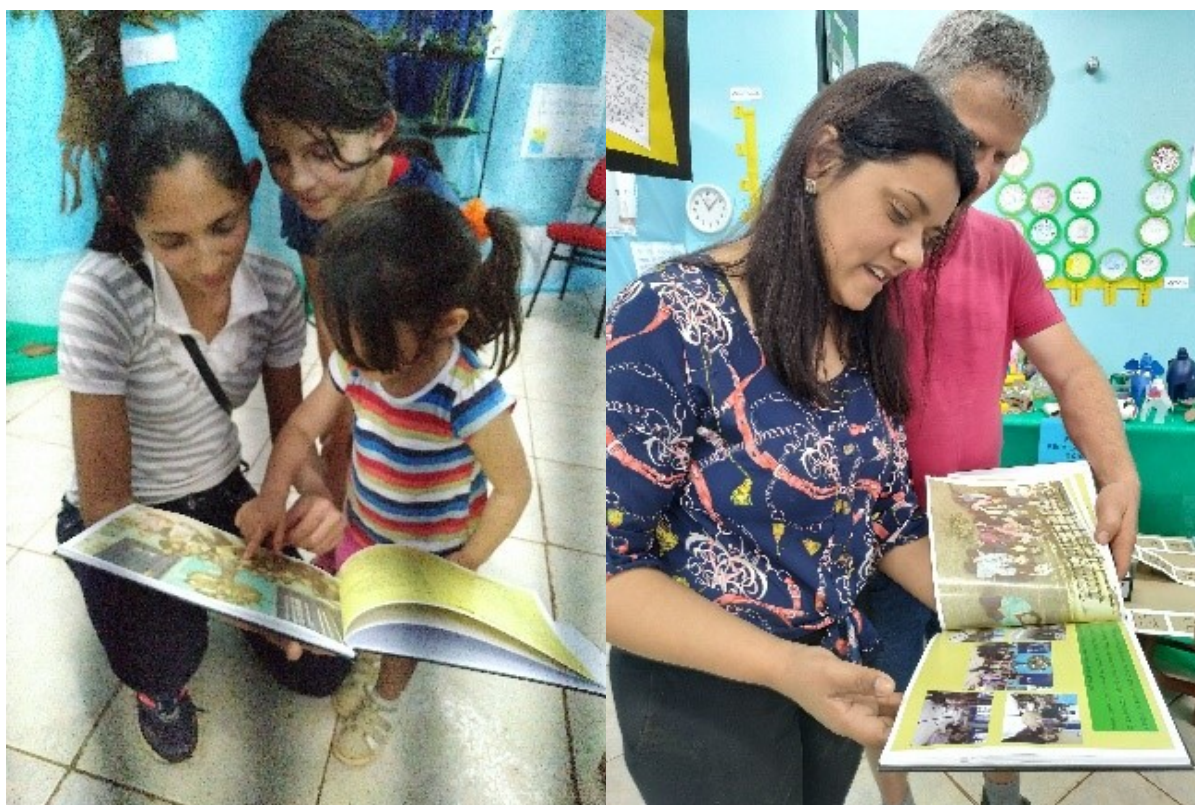
Figura 3: Devolutiva para as famílias e comunidade