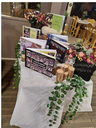
Figura 1: Livros impressos

Modalidade do trabalho: RELATO DE EXPERIÊNCIA Eixo temático: TRABALHO E EDUCAÇÃO