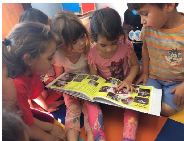
Figura 2: Devolutiva da documentação para as crianças