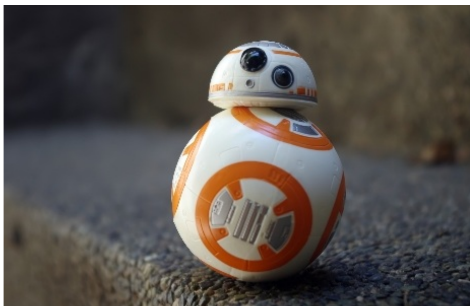
Figura 1 - BB-8

O BB-8 é um robô, o qual apareceu pela primeira vez em 2015, no filme Star Wars: the force awakens . Tem formato esférico, com a cabeça em forma de domo (meia esfera), com inteligência artificial.