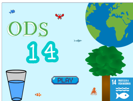
Figura 1 - Interface Inicial.

O desenvolvimento do jogo "Protegendo os Oceanos" foi realizado em um ambiente escolar, dentro do contexto de um projeto interdisciplinar envolvendo as disciplinas de Ciências, Geografia e Tecnologia. A atividade foi conduzida em grupos, onde os alunos participaram ativamente na concepção e implementação do jogo. Primeiramente, foram realizadas pesquisas sobre os impactos do lixo nos oceanos e a importância da preservação da vida marinha. Em seguida, os alunos colaboraram na criação do jogo, definindo o personagem principal, um mergulhador, que se move conforme a posição do mouse do jogador. A mecânica do jogo envolve o controle do mergulhador para que ele colete o lixo marinho, eliminando-o ao clicar sobre os detritos. O jogo foi programado para que, ao atingir a marca de 500 lixos eliminados, o jogador vença e contribua simbolicamente para a salvação da vida marinha. Todo o processo foi registrado em relatórios digitais, onde os alunos documentaram suas descobertas e reflexões sobre a importância da preservação dos oceanos. Na figura 1, podemos conferir a interface inicial do jogo.