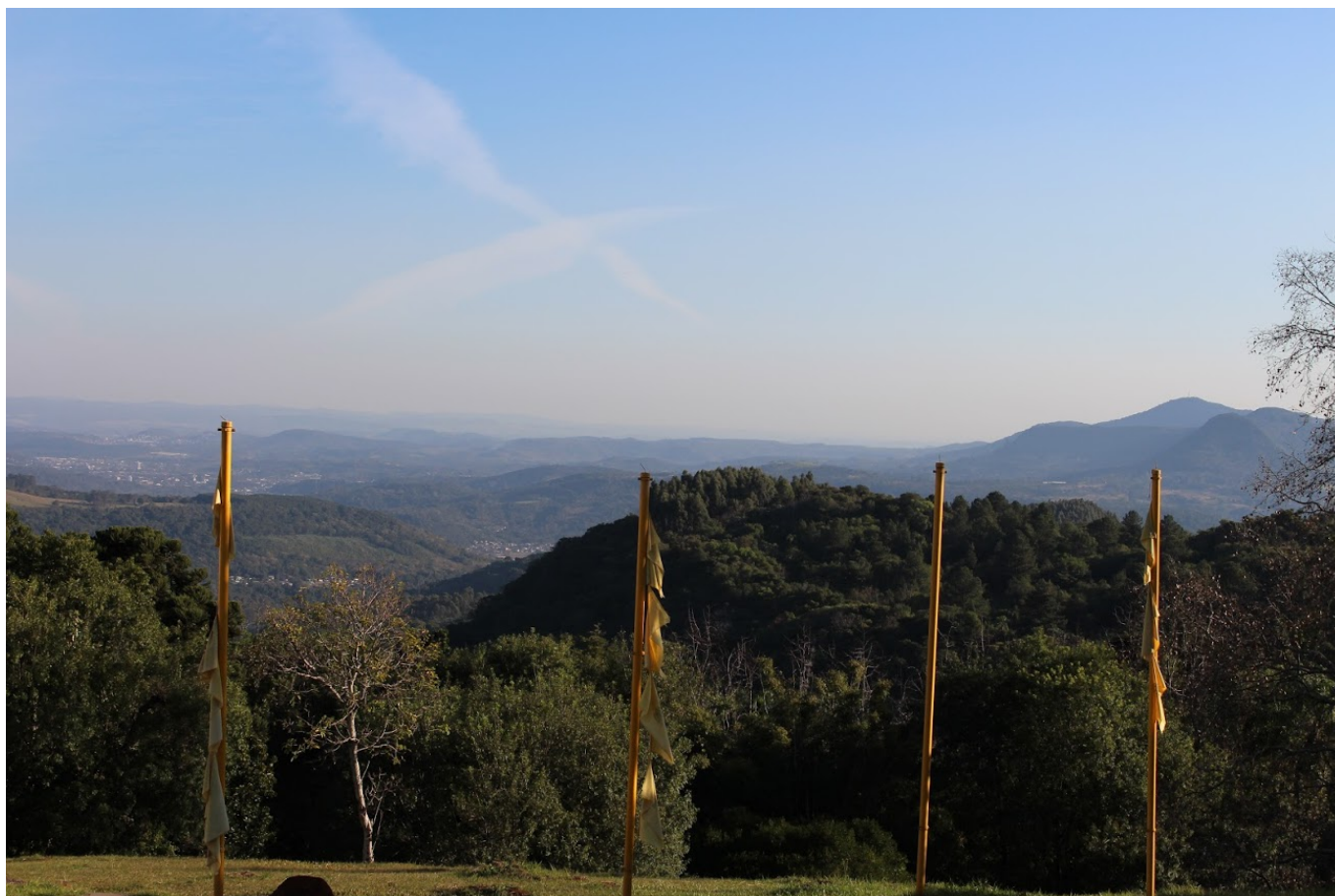
Local de construção do Templo Chagdud Gonpa Khadro Ling

No Rio Grande do Sul, o templo budista surgiu através dos tibetanos que tiveram que fugir da sua Pátria quando a China invadiu o seu território nos anos 50 particularmente monges e gurus que haviam sido proibidos de praticar a sua religião. Um destes gurus veio procurar exílio justamente aqui no Brasil, decidindo erguer seu templo numa região montanhosa que se assemelhasse à sua terra natal.