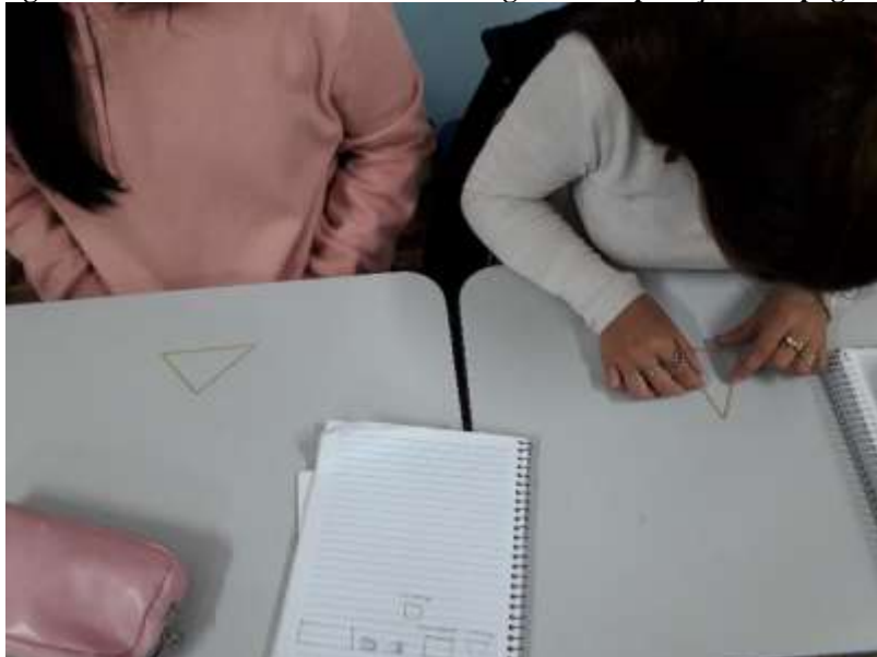
Figura 4 – Alunos tentando formar triângulos com pedaços de espaguete

Na sequência da mesma aula foi realizada uma atividade que considera a utilização de macarrão do tipo espaguete para discutir o que é necessário para que três segmentos de reta formem um triângulo. No decorrer da atividade, solicitou-se que os alunos quebrassem o espaguete em três pedaços, de forma aleatória. Após, os pedaços de espaguete deveriam ser unidos na tentativa de formar um triângulo, conforme pode ser observado na Figura 4.