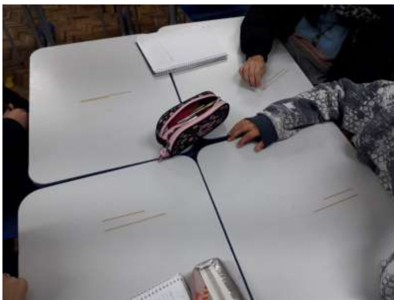
Figura 5 – Alunos comparando seus pedaços de espaguete

Destacamos que apenas um dos alunos não conseguiu formar um triângulo com os pedaços de espaguete, permitindo que a turma observasse que nem todos três segmentos de reta com medidas escolhidas ao acaso podem ser utilizados para formar um triângulo. Então, o professor solicitou que os alunos unissem dois dos seus pedaços de espaguete e comparassem com o terceiro pedaço, conforme pode ser observado na Figura 5.