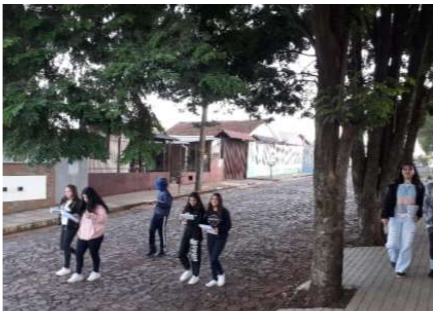
Figura 1 – Alunos durante caminhada para reconhecer formas poligonais em construções

Inicialmente, os alunos do 7º ano, acompanhados pelo professor, saíram para uma caminhada nos arredores da Escola, com a tarefa de observar a existência de polígonos nas construções, conforme retratado na Figura 1. Após anotarem os nomes dos polígonos que encontraram, os alunos voltaram à sala para discutir por que os triângulos foram um dos polígonos mais observado durante a caminhada, especialmente no formato dos telhados das residências.