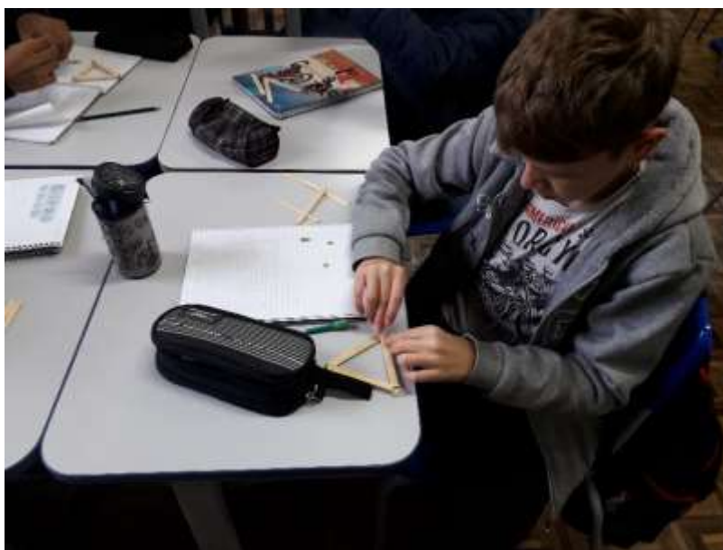
Figura 2 – Confeção de polígonos com palitos de picolé e percevejos

Para constatar essa propriedade, os alunos confeccionaram um triângulo e um quadrado utilizando palitos de picolé e percevejos. Foram utilizados sete palitos e sete percevejos: três de cada para o triângulo e quatro para o quadrado. As extremidades dos palitos foram unidas com os percevejos, como pode ser observado na Figura 2.