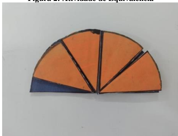
Figura 2: Atividade de Equivalência

A Figura 2 traz o registro de um exemplo de frações que não são equivalentes, registrada por uma dupla com um aluno que possui TDAH. Eles compreenderam que quando a fração não é equivalente, as peças não são exatamente do mesmo tamanho.