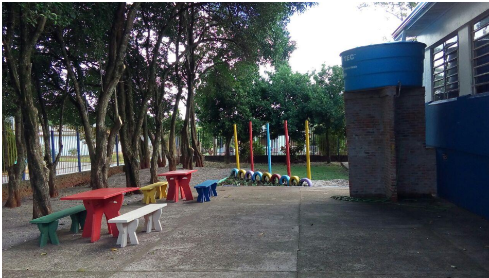
Figura 1: Foto da cisterna que foi construída em 2018.

do mês de março de 2018, onde a precipitação em dois meses de chuva foi mínima, cerca de 20 mm.