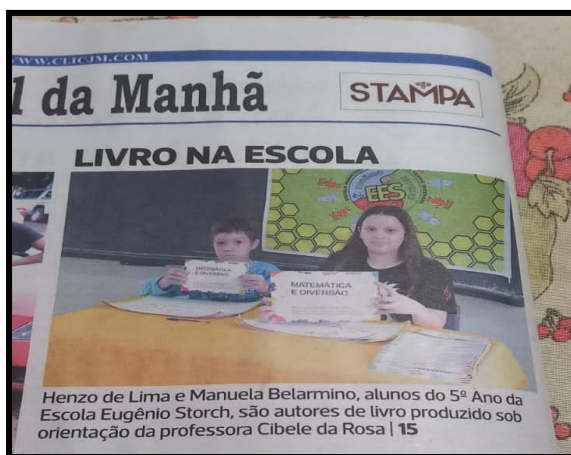
Figura 4 e 5: Reportagem no jornal e recebendo o livro.

Na escola foi realizado o Lançamento do livro com os patrocinadores, colegas da turma e profissionais da escola e para os patrocinadores. Para esse momento os educandos calcularam o valor a ser investido com lanche e realizaram a sessão de autógrafos.