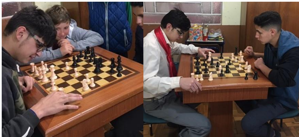
Figura 1 – Alunos jogando

Para isso, primeiramente estudamos e praticamos o Jogo de Xadrez, observando as suas regras e objetivos (conforme figura 1).