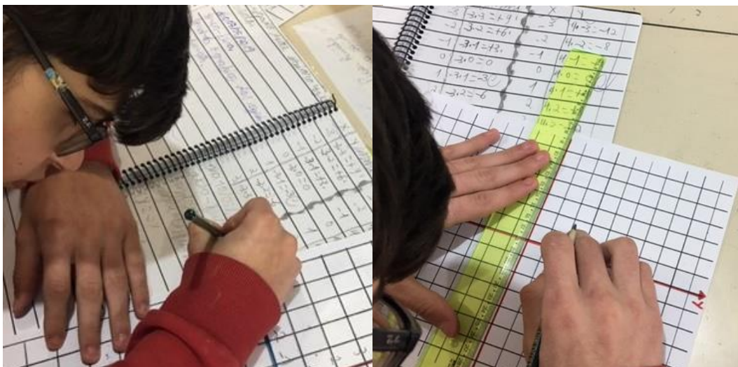
Registro: autora (2019)