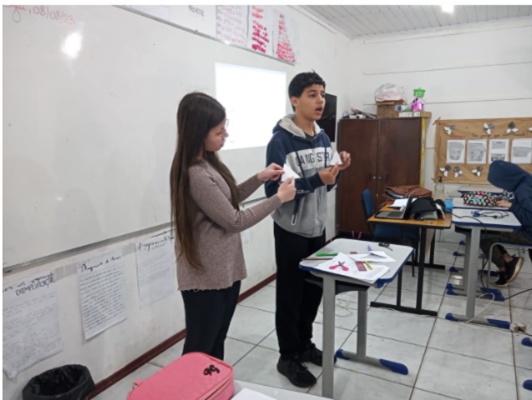
Figura 2: alunos em sala de aula apresentando o conteúdo para a turma 81