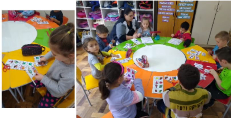
Figura 1 - Alunos confeccionando o jogo

em o aluno conseguiu colocar uma imagem semelhante ao lado da outra, retira um grão de pipoca. Vence quem tiver mais grãos.