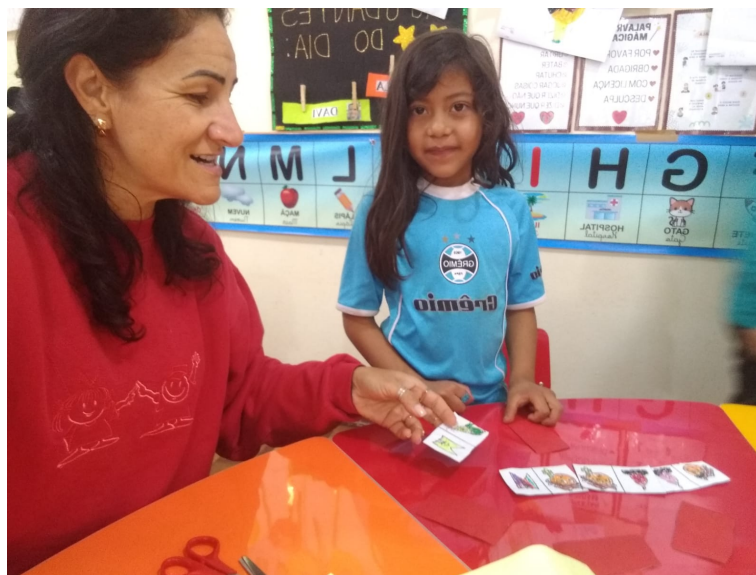
Figura 2- Jogando o jogo Dominó Memória