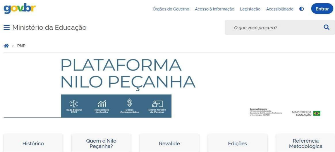
Figura 1: Plataforma Nilo Peçanha

Essa é uma plataforma de acesso livre, cuja página inicial está representada pela Figura 1, abaixo: