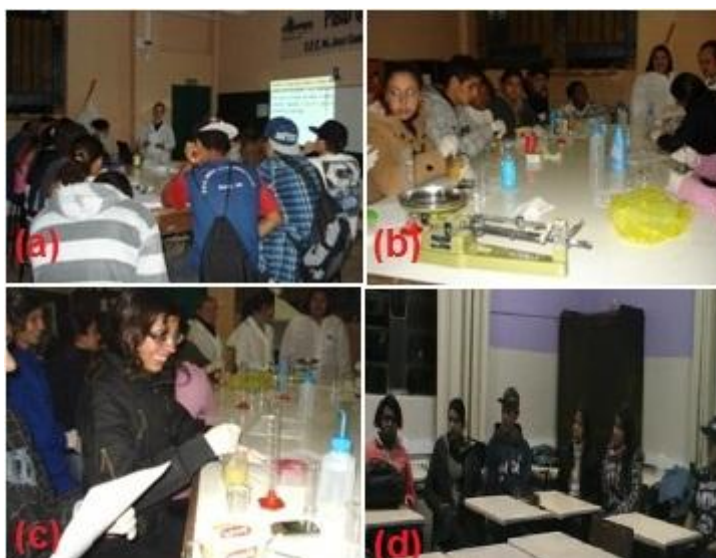
Figura 1: (a) aula expositiva; (b) (c) atividade experimental; (d) debate sobre os temas.

conscientização. Os acadêmicos, através da disciplina de química, trabalharam em turno inverso com 12 alunos de primeiro e segundo anos do ensino médio. O projeto foi desenvolvido durante quatro encontros divididos da seguinte forma: no primeiro encontro aplicou-se um pré-teste com o intuito investigar quais os conhecimentos prévios dos alunos sobre ácidos e bases, óleos e sabões e, questões ambientais, em seguida os principais tópicos do tema foram introduzidos. Em um segundo momento foi realizado uma aula expositiva dialogada introduzindo conteúdos sobre ácidos e bases. No terceiro encontro foi realizada uma atividade experimental no laboratório de química da escola onde a atividade consistiu da produção de sabão em barra a partir do óleo de cozinha a ser reciclado. A figura 1 representa algumas fotos que ilustram os momentos do projeto.