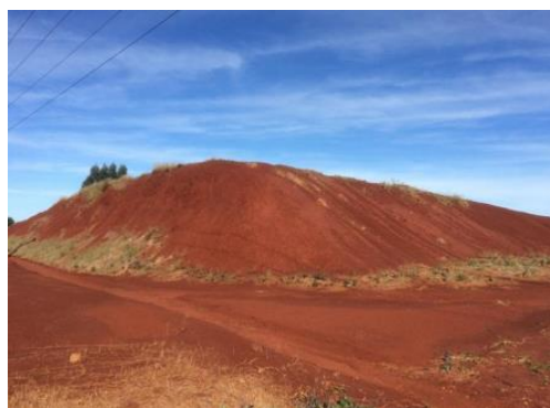
Figura 1: Perfil de solo localizado em Ijuí/RS

A Figura 1 mostra o perfil onde os solos foram coletados em Ijuí/RS.