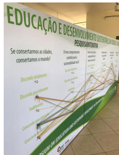
Figura 1. Painel Interativo

Por ser um painel interativo e auto avaliativo, os respondentes foram classificados por perfil, de acordo com a cor de linha utilizada para as respostas. A classificação dos perfis se organizou por: estudante, professor, funcionário, gestor público, representante de ONG, representante do setor privado e outros. A Fig. 1 ilustra o painel durante a pesquisa e a Fig. 2 apresenta o detalhe da diferenciação de cor de linha utilizada para cada perfil.