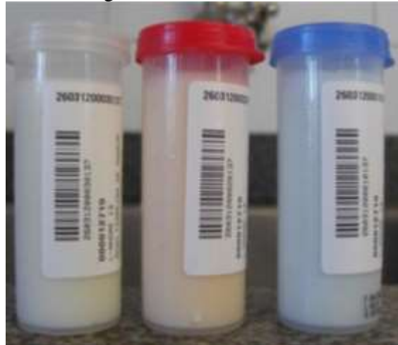
Figura 1. Amostras de leite.

As amostras são coletadas pelo próprio leiteiro, devendo sempre manter a higiene, pois suas mãos entrarão em contato com o leite, podendo invalidar as mesmas. Estas devem, também, ser conservadas a no máximo 7°C durante todo o transporte até chegar à empresa. Existem três tipos de amostras, a amostra diária, a CCS (Contagem de células somáticas) e a CBT (Contagem bacteriana total). Para a CCS a amostra não necessita ser conservada a 7°C, podendo ser conservada a temperatura ambiente, porém, deve ser agitada duas vezes a cada 15 minutos. Para a CBT é preciso que a amostra seja conservada a 7°C e também seja agitada. Já para a amostra diária apenas é necessário ser conservada a 7°C. Uma vez por mês é realizada a coleta de amostras de CCS e CBT, em dias separados. A identificação das amostras CBT e CCS é feita com código de barras, no qual é informado o código e o nome do produtor. Para a amostra diária não existe uma identificação padrão, em alguns casos o leiteiro anota o código do produtor no frasco, à mão ou em uma etiqueta de preços. Na figura 2 são demonstradas as amostras CCS, CBT e diária.